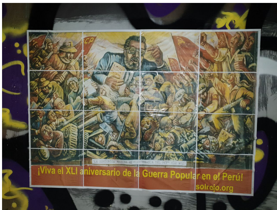
"Leve 41-årsdagen av folkkriget i Peru!" Spanien 2021