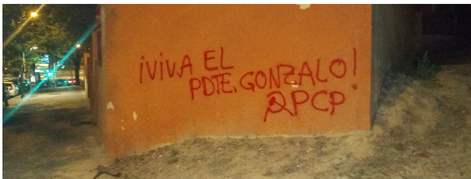
"Leve Ordförande Gonzalo! - PKP" Spanien, september 2021

Idag fortsätter PKP att leda folkkriget under de komplicerade och svåra omständigheter som råder, och tillämpar gonzalos tänkande för att lösa de nya problemen. Partiet fortsätter även sitt internationella arbete och åtar sig uppgiften att sprida Ordförande Gonzalos och den peruanska revolutionens bidrag till världsrevolutionen. Den nuvarande regeringen i Peru och dess president, som av revisionister och opportunisterna även i Sverige beskrivs som "vänster", har redan tydligt visat att de inte representerar något annat än Perus härskande utsugarklasser och är imperialistlakejer precis som alla sina föregångare. Denna regering fortsätter att tjäna yankeeimperialismens intressen, även om den liksom en del andra s.k. "vänsterregeringar" i Latinamerika förhandlar med den kinesiska imperialismen med utsikt om att kanske låta Peru bli dominerat och plundrat av en annan imperialistmakt än den nordamerikanska. För Perus arbetarklass och folk betyder detta fortsatt fattigdom och förtryck under den fallfärdiga byråkratkapitalismen och halvfeodalismen på landsbygden. Den enda vägen framåt för Perus folk fortsätter att vara folkkrigets väg, för att krossa och sopa bort denna gamla utsugarstat, befria landet från all imperialistisk dominans och fortsätta revolutionen tillsammans med världens proletariat och förtryckta folk tills utsugningen och klassamhället är ett minne blott.